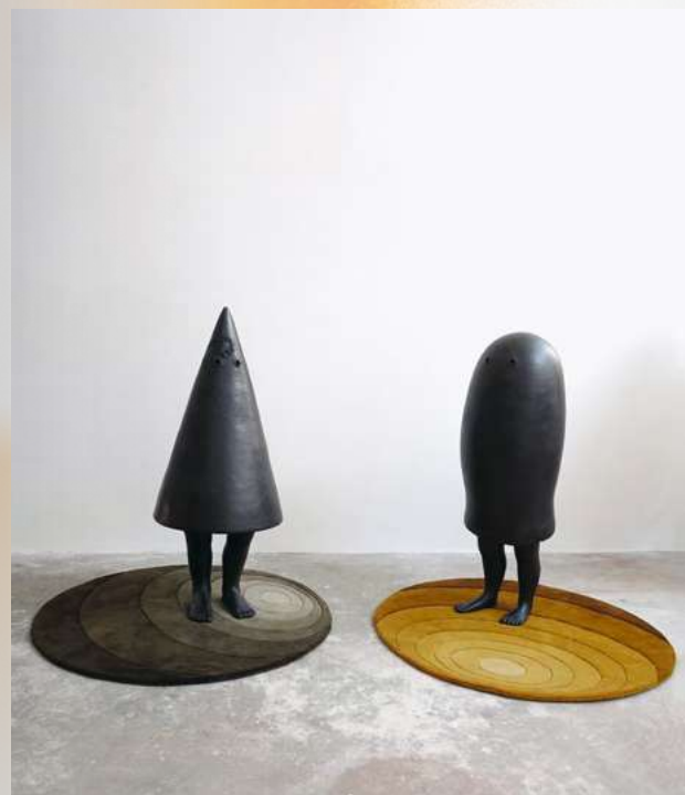
Anne Rochette. Silencieuse #1, #3 , 2018. ©Anne Rochette