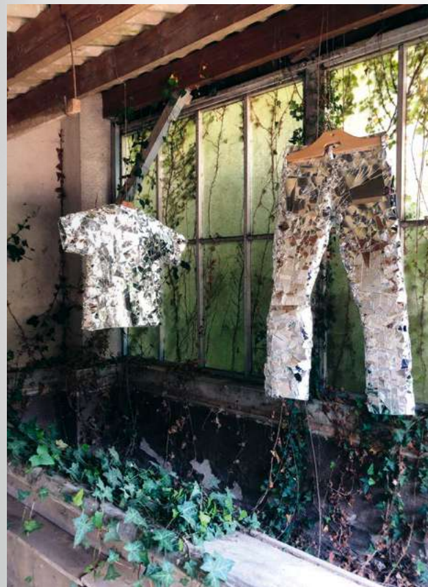
Baptiste Debombourg. Vrai semblant , 2023