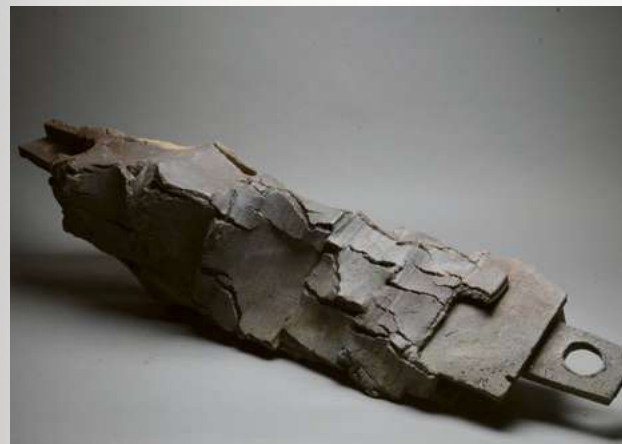
Michał Puszczynski. Axle , 2016.