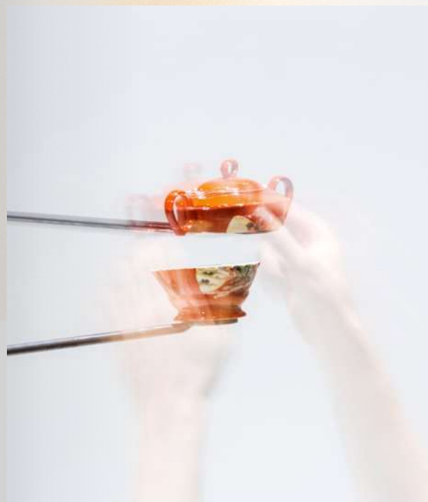
Pavla Sceranková. Collision of Galaxies , 2014.