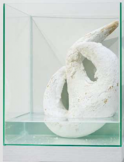
Lise Thiollier. This desert was once a sea , 2021 ©Alexandra de Cossette

🌐 SITE WEB : ville-mehun-sur-yevre.fr/tourisme/decouvrir-mehun/patrimoine/pole-de-la-porcelaine