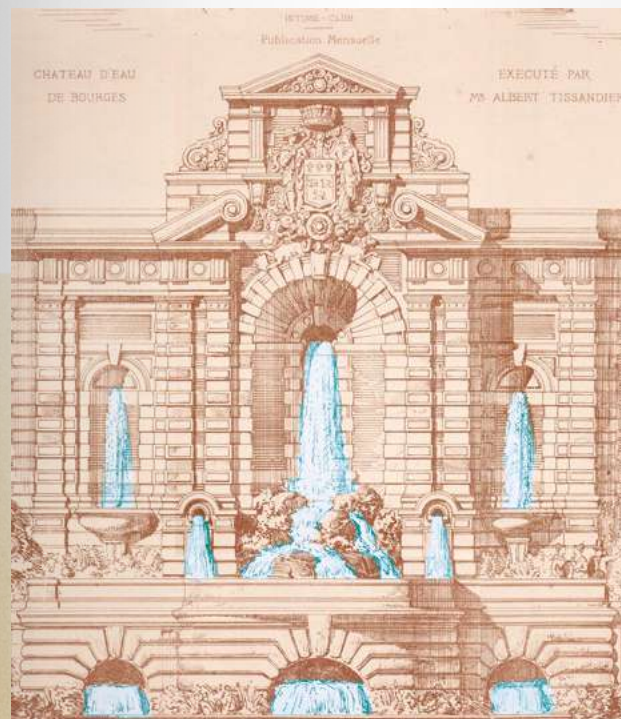
Dominique Blais. Étude pour L'écoulement, 2024. ©Dominique Blais

🌐 SITE WEB : antrepeaux.net | ville-bourges.fr/site/chateau-eau