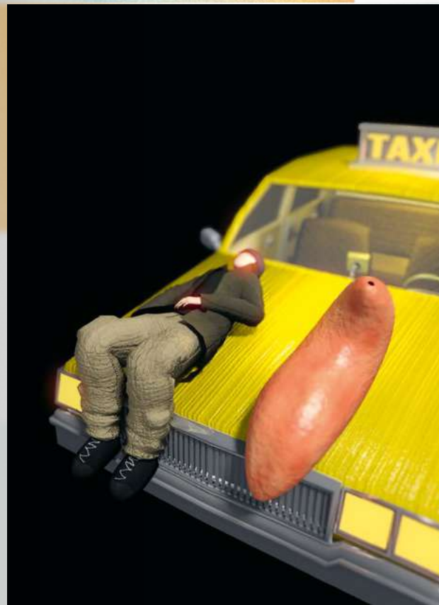
Visuel de l'exposition Are we there yet? , 2024 ©Woojung Yim et Abel Duché