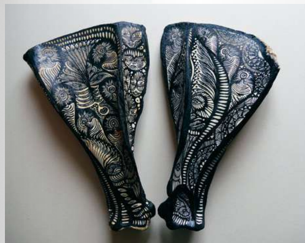
Margot. Let's the bones talk . ©Margot