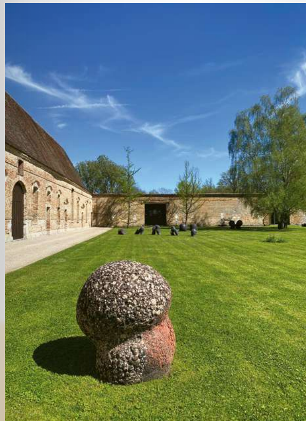
Claudi Casanovas (au 1 er plan), Corallina-B