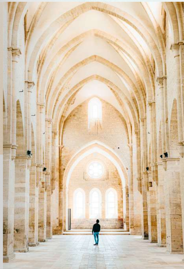
Visite de l'abbaye.