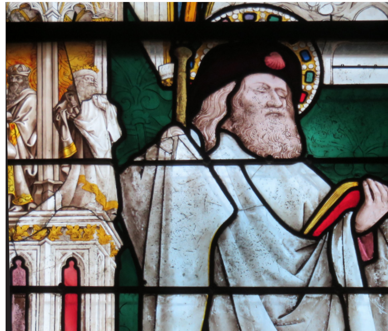
N°24. Chapelle Saint Paul